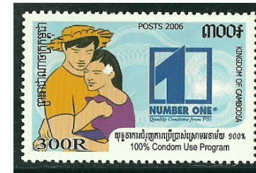
CAMBODGE 2006 : Number One – Marque de Préservatifs